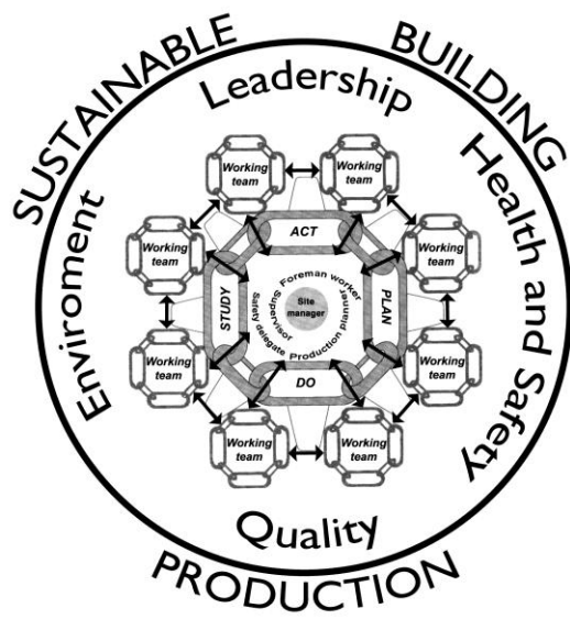
Figure 2. Integrated Planning for Sustainable Building Production (Refined model)