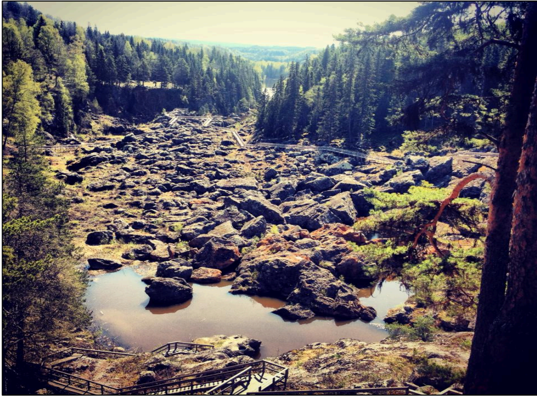
Fig. 4.3. Döda fallet i Västerede, Ragunda.