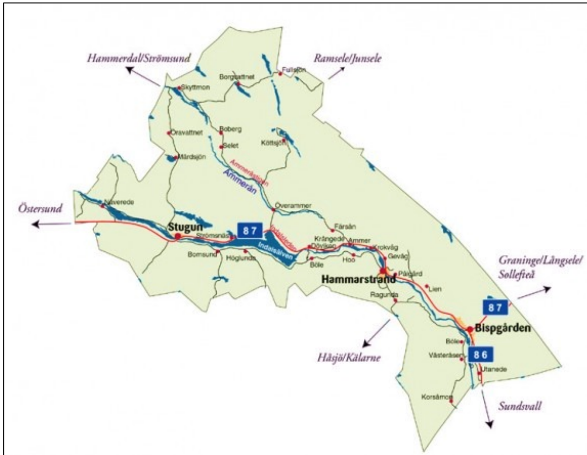
Fig. 4.2. Ragunda kommunkarta.

I Ragunda ligger platsen för Sveriges största naturkatastrof i modern historia; ”Vildhussens” tömning av Ragundasjön 1796. Händelsen, som har en väldokumenterad historia, resulterade i den tystnade forsen Döda fallet (se Fig. 4.3.) som idag är ett av Jämtlands viktigaste besöksmål. Döda Fallet är Ragundas mest kända kulturarvsplats och vid fallet står dessutom Sveriges första vridläktare vid vilken flertalet teaterföreställningar satts upp genom åren (Ragunda.se, 2013-05-23). Ragundas andra stora kulturarvsplats är King Chulalongkorn Memorial, även kallad Thailändska paviljongen (se Fig. 4.4.). Den uppfördes under 1990-talet till minne av kungen av Siam:s resa till Sverige år 1897. Paviljongen är den enda i sitt slag utanför Thailand och har under åren bland annat utgjort en arena för kulturellt utbyte mellan Sverige och Thailand (thaipaviljongen.se, 2013-05-23). Kommunen är idag även känd för att ha Sveriges näst bästa kulturskola (Calvo, 2013) som är avgiftsfri och integrerad i den ordinära skolverksamheten. I kommunen finns även flera hembygdsföreningar, byföreningar och andra organisationer som anordnar kulturaktiviteter (Ragunda.se, 2013-05-23).