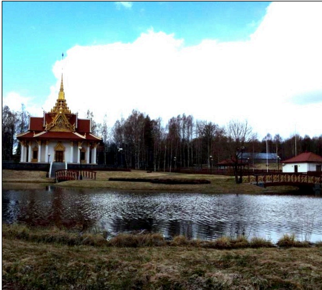
Fig. 4.4. Thailändska paviljongen i Utanede, Ragunda.