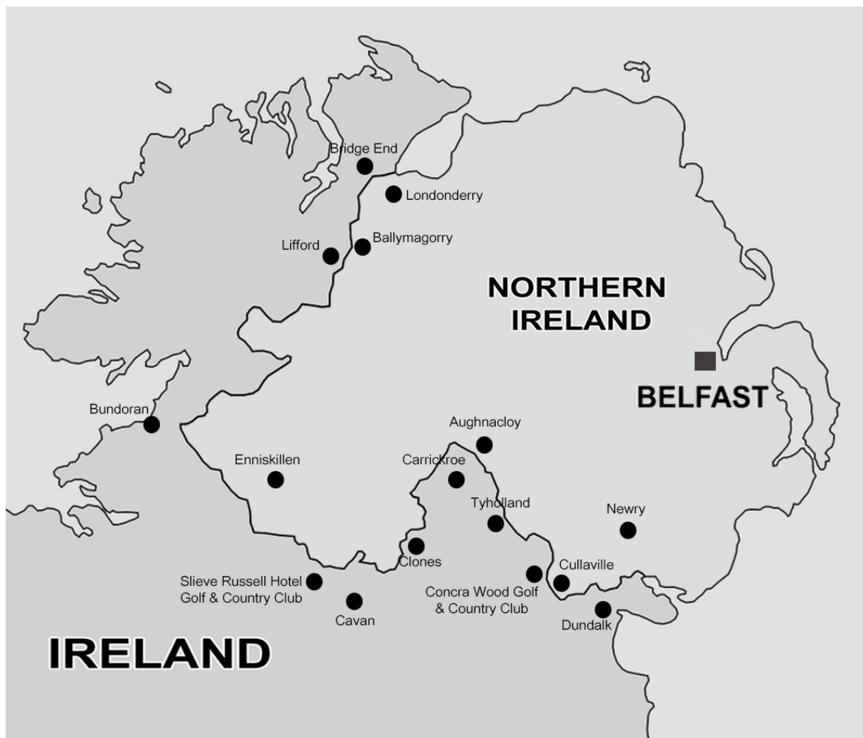
Figur 2. Karta över de orter där vi valde att kontakta företag, baserat på läge och typ.

För denna studie ansågs det vara tillräckligt med 10 intervjuer, detta då det bidrar till avgränsning och reliabiliteten. Intervjuerna var semistrukturerade i syfte att kunna anpassa frågorna efter den som intervjuas. Frågorna formades på ett neutralt sätt och redovisades anonymt i arbetet. Syftet med intervjuerna var att få svar på hur dessa typer av aktörer tänker i den kommande situationen. Detta för att se om de har gjort upp en plan för hur turismen ska hanteras, för att bibehålla och öka besökarantalet. Intervjuerna hölls korta för att inte verka avskräckande samt med tydliga frågor för att stärka validiteten. Under den första mailkontakten skickade vi även en noggrann beskrivning om vad svaren kommer användas till. Intervjuerna genomfördes sedan via e-mail eller Skype samtal. Svaren relaterades sedan till forskning för att hitta gemensamma faktorer som kan bidra till en lösning för liknande händelser.